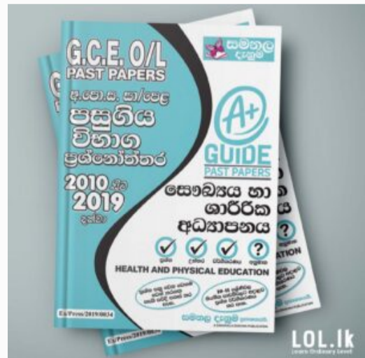
GCE O/L EXAM, HEALTH & PHYSICAL EDUCATION O/L Health & Physical Education Past P...