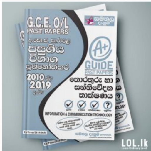
GCE O/L EXAM, INFORMATION & COMMUNICATION TECHNOLOGY O/L Information & Communication Tec...