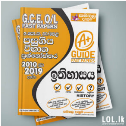
GCE O/L EXAM, HISTORY O/L History Past Paper Book