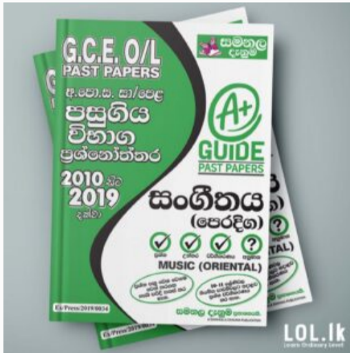
GCE O/L EXAM, MUSIC O/L Music Past Paper Book