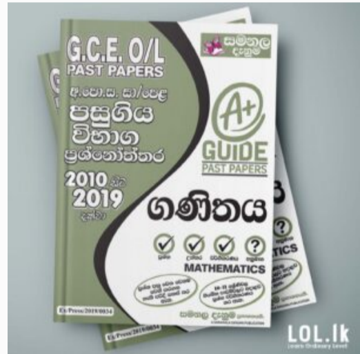
GCE O/L EXAM, MATHEMATICS O/L Mathematics Past Paper Book