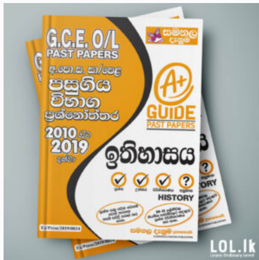
GCE O/L EXAM, HISTORY O/L History Past Paper Book