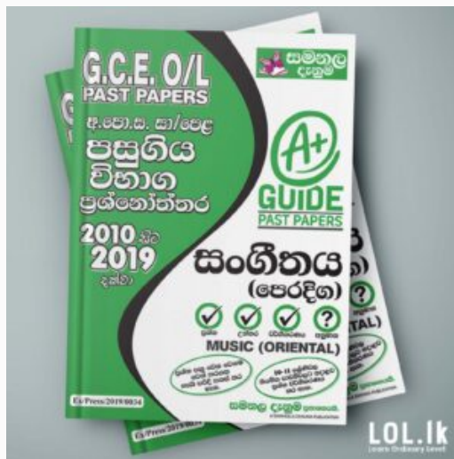
GCE O/L EXAM, MUSIC O/L Music Past Paper Book