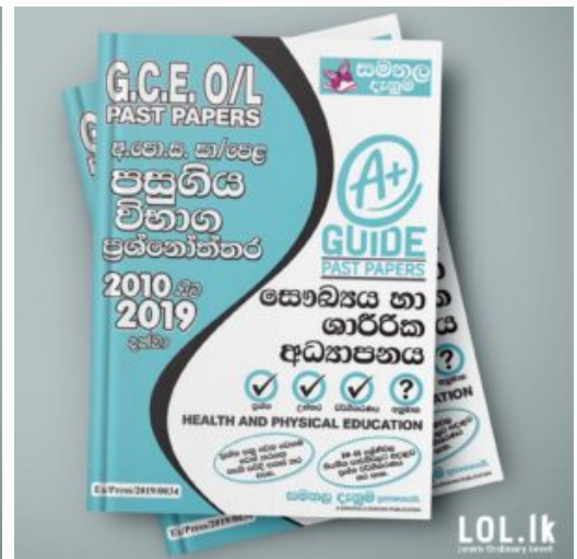
GCE O/L EXAM, HEALTH & PHYSICAL EDUCATION O/L Health & Physical Education Past P...