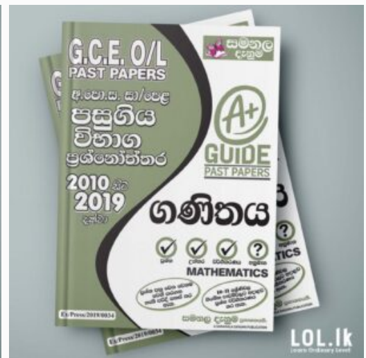
GCE O/L EXAM, MATHEMATICS O/L Mathematics Past Paper Book