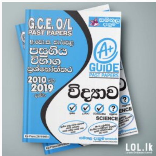
GCE O/L EXAM, SCIENCE O/L Science Past Paper Book