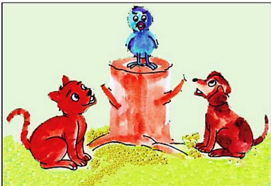
රූපිකානු පින්තූර කතා මහාන ඇසුරෙන් අදින ලද්දකි.