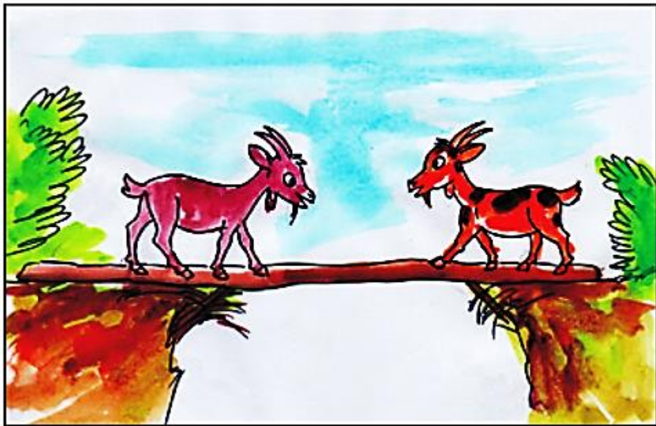
රූපිකානු පින්තූර කතා මහාන ඇසුරෙන් අදින ලද්දකි.